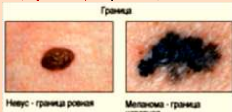
Неvus - граница ровная Меланома - граница неровная