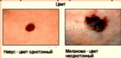
Неvus - цвет однотонный Меланома - цвет неоднотонный

В одном пигментном пятне могут встречаться очень черные участки наряду с менее окрашенными.